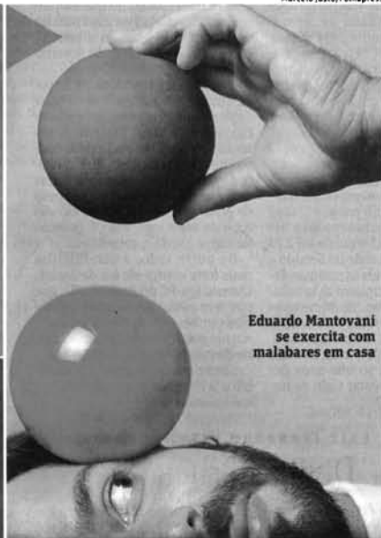
Eduardo Mantovani se exercita com malabares em casa