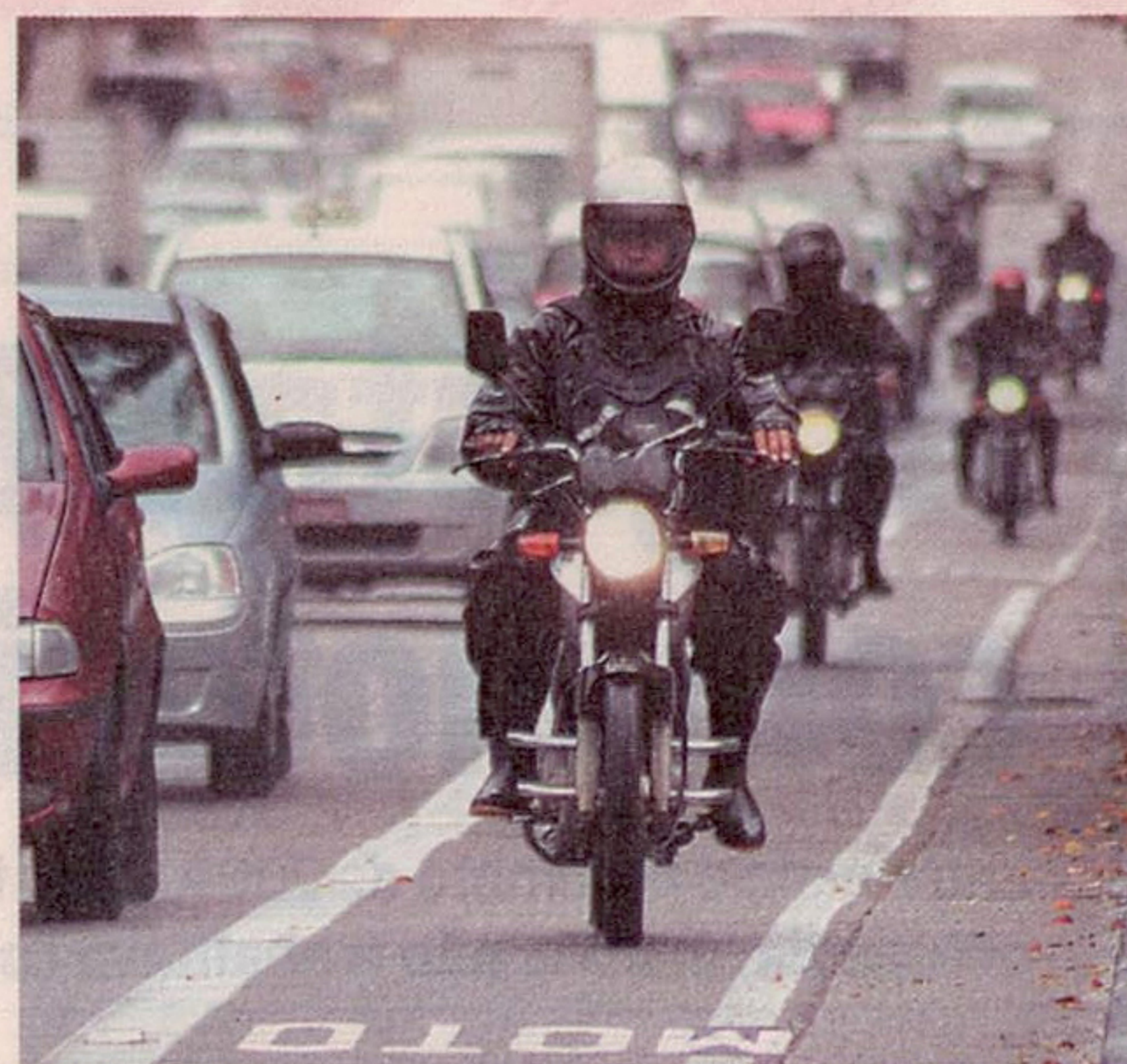
Motofaixa na rua Vergueiro: cidade já tem 843 mil motocicletas

A cidade já possui cerca de 843 mil motos. Em 2005, esse número não passava de 504 mil, um crescimento de 67% na frota em apenas cinco anos. Nesse intervalo, a quantidade de motociclistas mortos variou bastante: chegou a 350 em 2005, atingiu o topo em 2008 (465 vítimas) e recuou em 2009 para 364 casos. ●