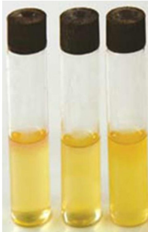
Figura 1 – Frascos com tioglicolato